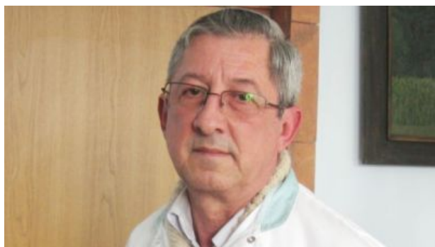
Redam minuta sentintei nr. 471/2017 a Tribunalului Bacau:

Lipsa oricarei cai de atac impotriva unei hotarari pronuntate in instanta echivaleaza cu imposibilitatea exercitarii unui control judecatoresc efectiv, dreptul de acces liber la justitie devenind astfel un drept iluzoriu si teoretic”.