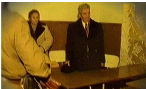
Aparatorii sotilor Ceausescu s-au transformat in acuzatori.

Reluandu-se dezbaterile, avocatii au informat tribunalul ca nu au alte probe de solicitat in aparare cum si imprejurarea ca inculpatii sustin ca au o stare de sanatate corespunzatoare si ca nu au suferit si nu sufera de vreo maladie psihica care sa le diminueze discernamantul, cerand instantei sa ia act ca nu au alte probe de administrat si ca se poate trece la judecarea cauzei in fond”.