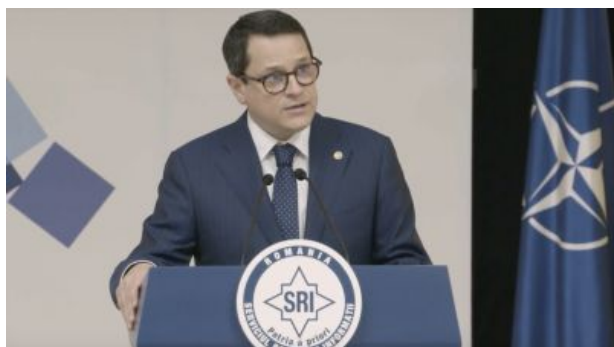
Despre protocoale si SRI

Am si trimis de-a lungul timpului inclusiv o scrisoare ambasadorului american, care a avut mai multe iesiri in apararea (spunea Excelenta Sa) independentei justitiei, in care i-am reamintit ce spunea presedintele american JFK (n.r. John Fitzgerald Kennedy) ca nu exista o administratie sanatoasa care sa fie lipsita de critica. Si indemnna pe toata lumea sa critice guvernul, administratia, puterile, pentru ca este un lucru sanatos: obliga sistemul sa se autoexamineze, sa verifice criticile si acolo unde este cazul sa le corecteze in starea incipienta, nu cand au ajuns problemele la nivel de sistem si trebuie sa alegi intre a darama sistemul si a reconstrui altul. Nu este admisibil sa lasam lucrurile sa derapeze intr-o masura atat de grava. (...)"