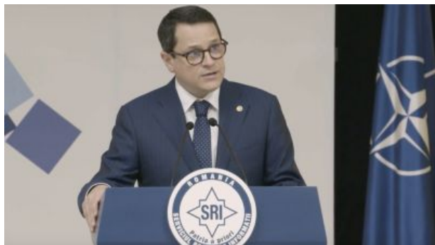
Despre protocoale si SRI

Am si trimis de-a lungul timpului inclusiv o scrisoare ambasadorului american, care a avut mai multe iesiri in apararea (spunea Excelenta Sa) independentei justitiei, in care i-am reamintit ce spunea presedintele american JFK (n.r. John Fitzgerald Kennedy) ca nu exista o administratie sanatoasa care sa fie lipsita de critica. Si indemnna pe toata lumea sa critice guvernul, administratia, puterile, pentru ca este un lucru sanatos: obliga sistemul sa se autoexamineze, sa verifice criticile si acolo unde este cazul sa le corecteze in starea incipienta, nu cand au ajuns problemele la nivel de sistem si trebuie sa alegi intre a darama sistemul si a reconstrui altul. Nu este admisibil sa lasam lucrurile sa derapeze intr-o masura atat de grava. (...)"