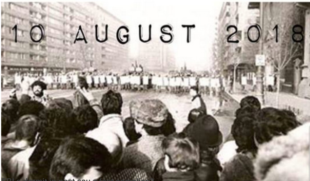
SRI a dormit in post sau a fost complice!

Sa mergem cu totii in Piata Victoriei , acum este momentul sa le aratam clasei politice un vot de blam !!! sa dam cu clasa politica de pamant , poporul trebuie sa preia puterea , Drepturile Universale ale Omului ne dau dreptul la revolutie impotriva conducatorului opresor !!!!