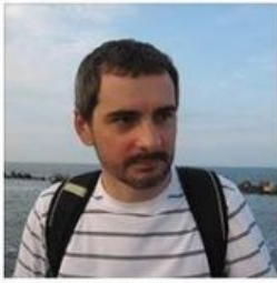
Fotografii de profil 2 fotografii