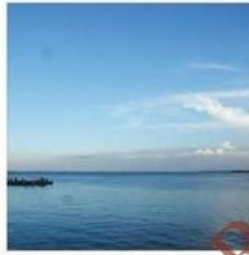
Fotografii de copertă 1 fotografie