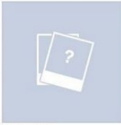
De pe mobil 1 fotografie