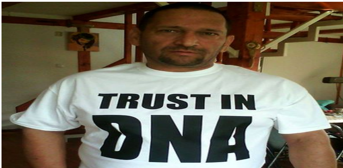
Ale naibii coincidente